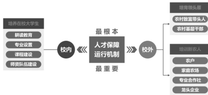
图2 涉农高职助力乡村振兴人才保障路径

人才是乡村振兴等关键。涉农高职院校作为乡村实用技术人才培养主阵地,要进一步深化产教融合、校农结合,采取校企、校校、校政合作以及专业、课程等改革,开展多层次全方位的技术技能培训,培养“素质高、技能强、下得去、用得好”的技术技能型人才。